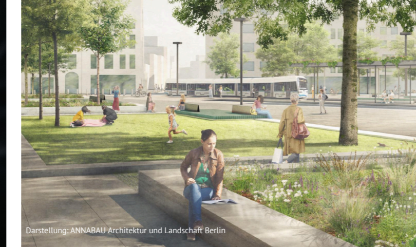
Darstellung: ANNABAU Architektur und Landschaft Berlin